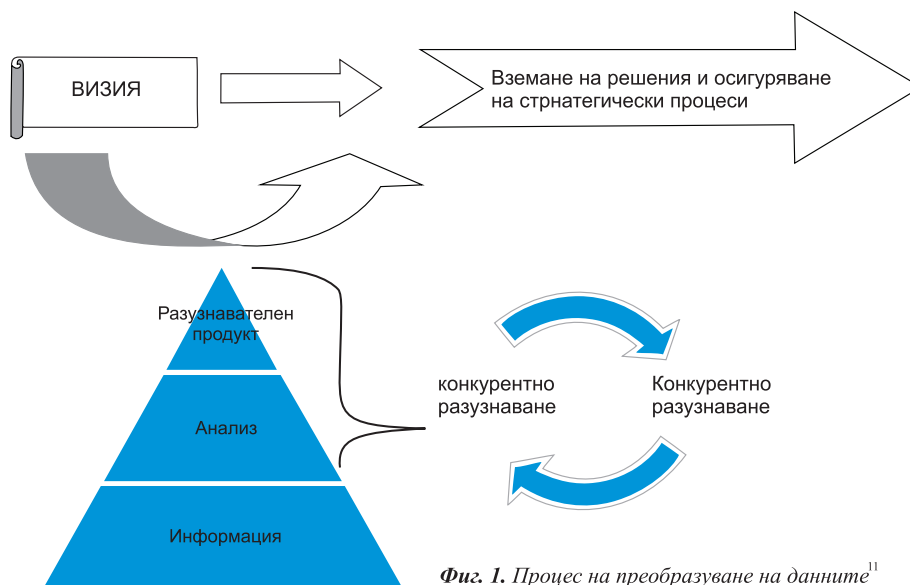
Фиг. 1. Процес на преобразуване на данните 11

Бившият директор на Централното разузнавателно управление на САЩ, Робърт Майкъл Гейтс (Robert M. Gates) смята, че както всяка професионална дисциплина, разузнаването е многостранно. То включва дейност. То включва знания. Включва организация. Но не трябва да се бърка с проучване на пазара, нито пък с „информационно обслужване“. 8 Конкурентното разузнаване, заедно с близка си по дисциплина-контра разузнаването, представляват „първата линия на защита“ 9 на компанията срещу заплахите за нейната дейност, планове и стратегически амбиции. (Gates, 1987). 10