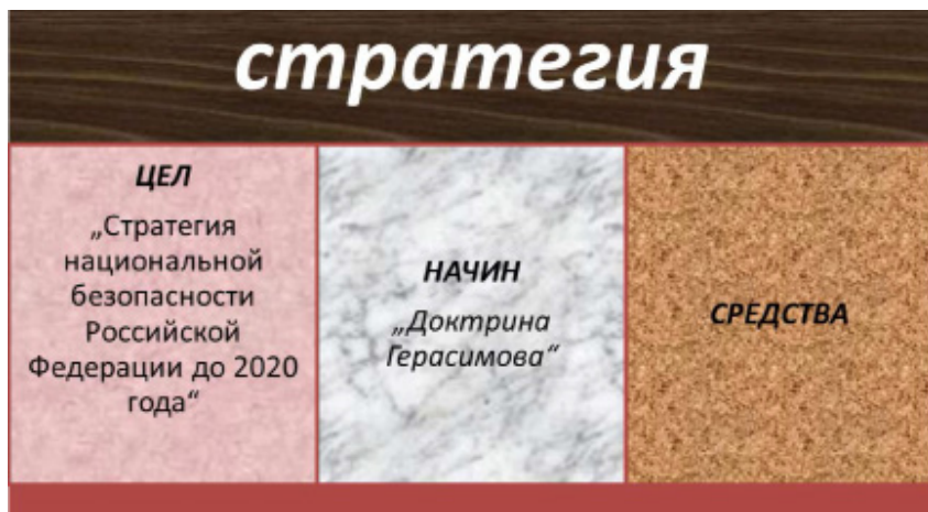
Фиг. 4. Същност на стратегията съгласно Максвел Тейлър при формулирането на „начин“ на РФ.

тието на икономиката, укрепването на позициите на Русия в международната общност. Тази концепция е основа за използването на невоенните средства, основно икономически и финансови при реализирането на целите на стратегията, разбира се при необходимото ниво на дипломатическа подкрепа.