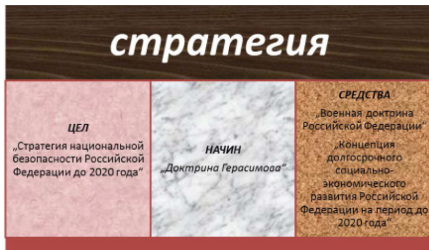
Фиг. 5. Същност на стратегията съгласно Максвел Тейлър при формулирането на „средства“ на РФ.

Разглеждайки оперативно-изкуството на руската военна школа е необходимо да се отбележи, че това е най-младият дял на военната наука, офици-