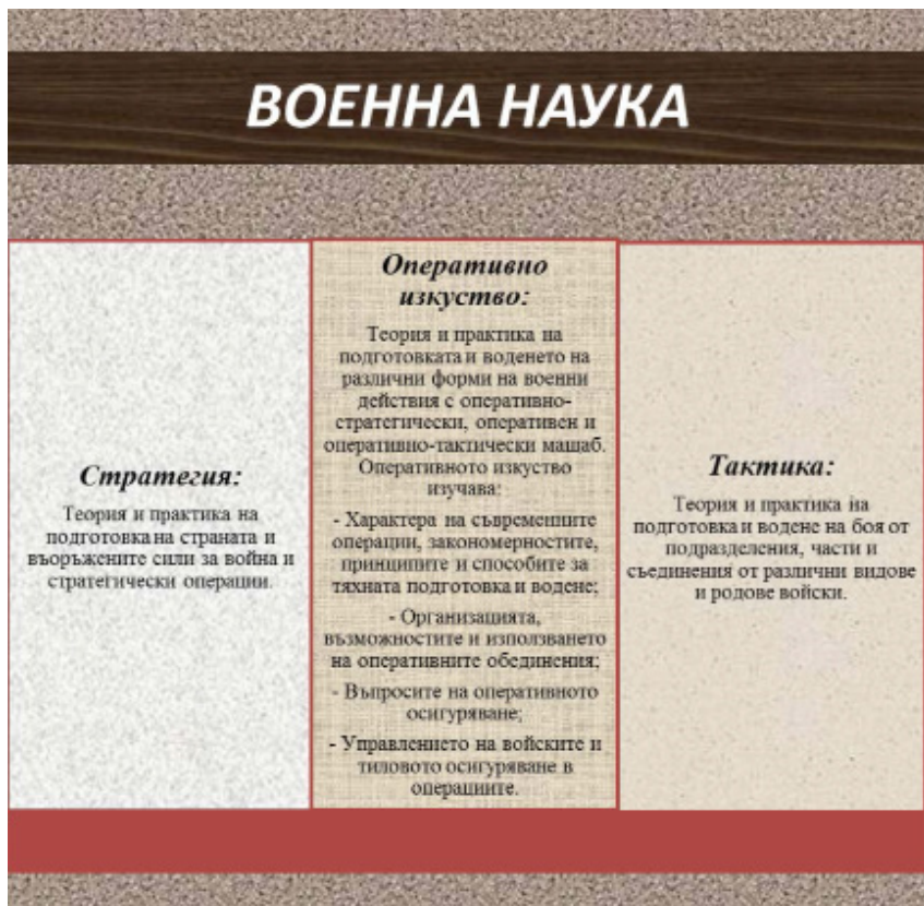
Фиг. 1. Структура на военната наука на Руската Федерация.

в момента не съществува. Следователно е наложително да си отговорим на въпроса: Разполага ли Руската Федерация с военна стратегия за реализиране на своите национални интереси и геополитически цели? За тази цел е необходимо да се представи стратегията съгласно вижда-