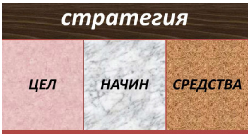
Фиг. 2. Същност на стратегията съгласно Максвел Тейлър.

Разглеждайки основните документи на Руската Федерация се откроява един основополагащ документ наречен „Стратегия национальной безопасности Российской Федера-