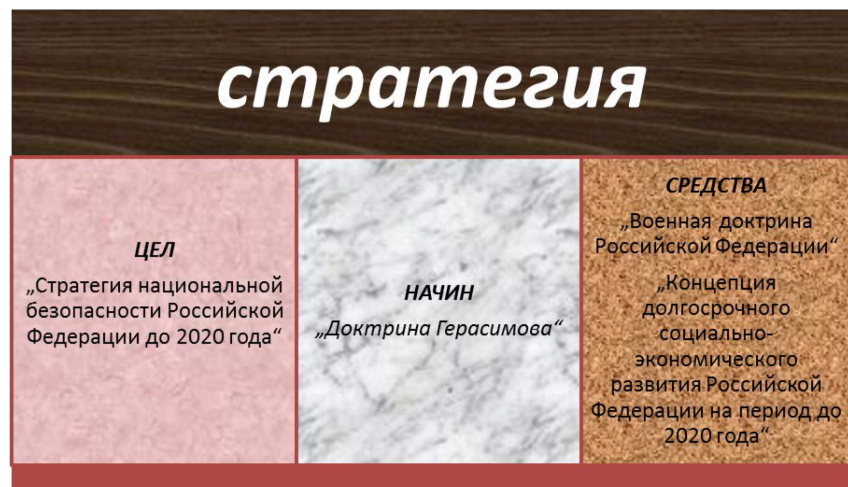
Фиг. 5. Същност на стратегията съгласно Максвел Тейлър при формулирането на „средства“ на РФ.

Разглеждайки оперативното изкуство на руската военно школа е