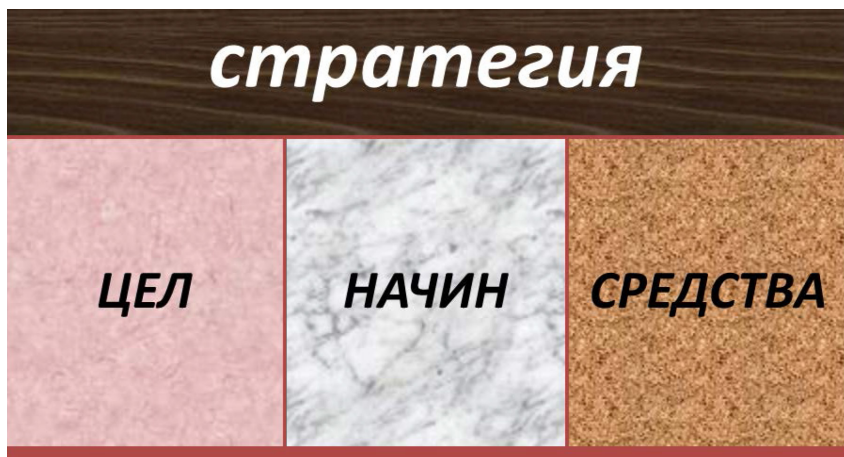
Фиг. 2. Същност на стратегията съгласно Максвел Тейлър.

Руската Федерация с военна стратегия за реализиране на своите национални интереси и геополитически цели? За тази цел е необходимо да се представи стратегията съгласно вижданията на Максвел Тейлър, като единство между цел, начин и средства (Фиг. 2).