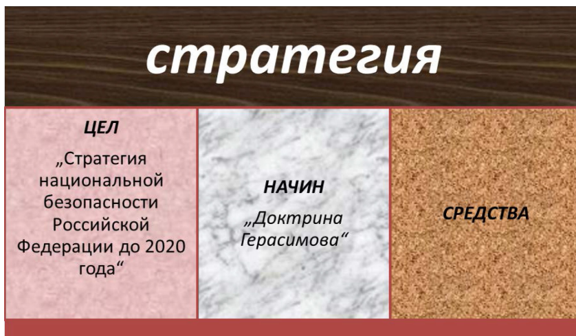
Фиг. 4. Същност на стратегията съгласно Максвел Тейлър при формулирането на „начин“ на РФ.

2010 г. В нея се разглеждат основните военни заплахи за Руската Федерация, редът за използване, изграждане и развитие на въоръжените сили и други войски, военно-икономическото осигуряване на отбраната на страната, мобилизационното осигуряване на въоръжените сили и военно-патриотичното възпитание в Русия. Следователно това е документа, регламентиращ използването на военни средства за нуждите на военната стратегия 5 .